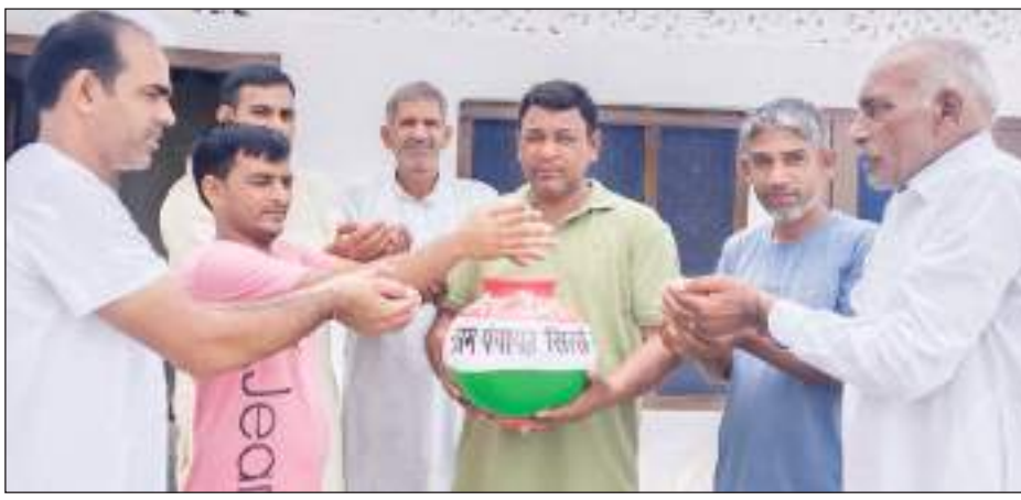
गति प्रदान करते हुए घर-घर जाकर कलश में मिट्टी एकत्रित की और आमजन को अभियान के बारे में जागरूक किया। इस

करनाल/टीएम एक्शन इंडिया। करनाल जिला में मेरी माटी मेरा देश अभियान पूरे जोर-शोर से चल रहा है और गांव-गांव जाकर माटी को नमन व वीरों का वंदन करने का कार्य निरंतर जारी है। पंच प्रण के संकल्प के साथ लोग बहुत पवित्र भाव से अपनी भावनाएं इस अभियान के साथ जोड़ रहे हैं। कोई तुलसी की जड़ की मिट्टी दे रहा, तो कोई केले की जड़ से, कोई अपने देवालय से, कोई शिवालय से, कोई रसोई की मिट्टी दे रहा है। सच में गांव के लोगों के अंदर देश प्रेम की भावनाएं बहुत प्रबल हैं। बीरवार को अभियान के तहत करीब एक दर्जन गांवों में नेहरू युवा केन्द्र के वॉलंटियर्स ने अभियान को