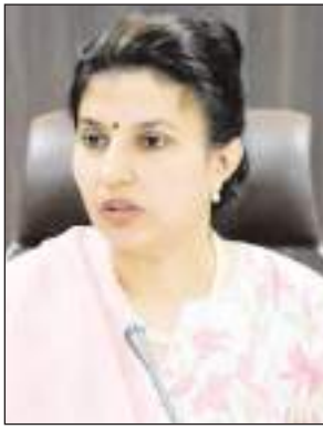
सम्मानित किया जाना है।

जो पूज्य महात्मा गांधी को उनकी जयंती के दिन श्रद्धांजलि होगी। स्वच्छ भारत दिवस-2023 की प्रस्तावना के रूप में स्वच्छता ही सेवा वार्षिक पखवाड़े स्वच्छ भारत मिशन-ग्रामीण व शहरों द्वारा संयुक्त रूप से आयोजित किया जा रहा है। स्वच्छता ही सेवा-2023 का थीम "कचरा मुक्त भारत है" जिसमें साफ-सफाई पर ध्यान दिया जाना है और सफाई मित्रों को