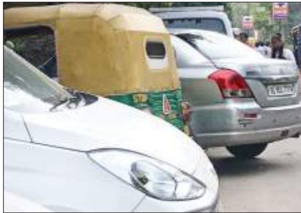
रखी हैं, तो वहीं लोगों ने अपने निजी वाहन खड़ा करके पार्किंग ही बना दी है। अतिक्रमण का शिकार पॉश एरिया: लेकिन यहाँ पर हम बात

चाहें वह दिल्ली की मुख्य सड़क हो या फिर कॉलोनी की छोटी-छोटी गलियाँ ही क्यों न हों, सभी जगह का बुरा हाल है, कहीं पर रेहड़ी-पटरी लगाकर सड़क कब्जा