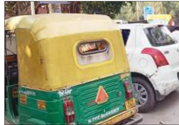
भी बुरा हाल है, लोगों ने सड़क के दोनों साइड पर अपने वाहन पार्क किए हुए हैं, जिससे सड़क तो संकरी होती ही है बल्कि जाम की स्थिति भी बनी रहती है। वहीं

वेतरतीब गाड़ी खड़ी करके इस कदर घेर लिया है, जिससे कि कोई आपातकालीन वाहन का भी निकलना मुश्किल है। वहीं सुभाष पैलेस थाना के पास