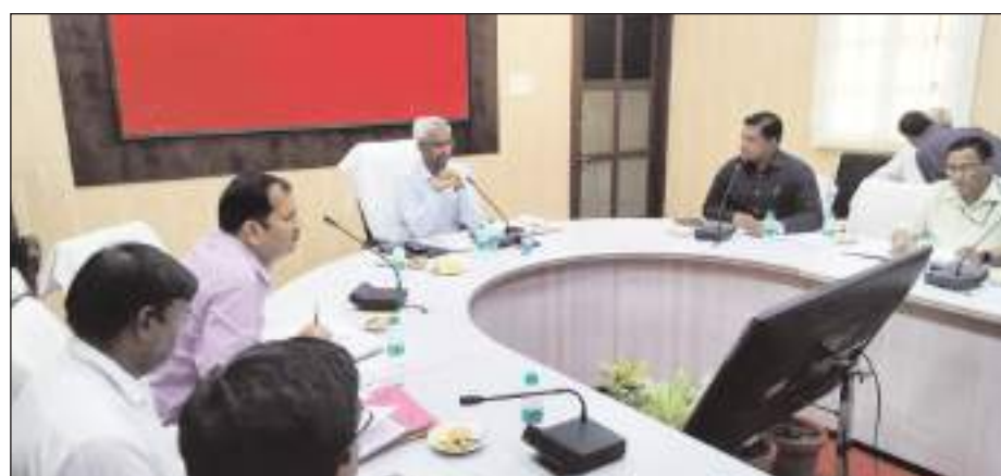
पर्यावरण पर होने वाले दुष्प्रभाव के बारे में नागरिकों को जागरूक किया जाय। जैव चिकित्सा अपशिष्ट प्रबंधन के अंतर्गत

मथुरा/टीएम एक्शन इंडिया जैव चिकित्सा अपशिष्ट प्रबंधन को लेकर नवागत जिलाधिकारी सख्त हैं। जिलाधिकारी शैलेन्द्र कुमार सिंह ने कलेक्ट्रेट सभागार में जिला गंगा तथा पर्यावरण समिति की बैठक ली। ठोस अपशिष्ट प्रबंधन कांस्ट्रक्शन वेस्ट, ई वेस्ट, जैव चिकित्सा अपशिष्ट प्रबंधन के निस्तारण की प्रगति की बिंदुवार समीक्षा की। श्री सिंह ने अधिशाषी अधिकारी नगर निगम, नगर पालिका परिषद तथा नगर पंचायत के अधिकारियों से कहा कि सभी बाड़ों में स्वच्छता का विशेष ध्यान दें और कूड़ा का उठान समय से कराते हुए निगरानी भी करें। सिंगल यूज प्लास्टिक पर पूर्ण रूप से प्रतिबंध भी करें और इससे