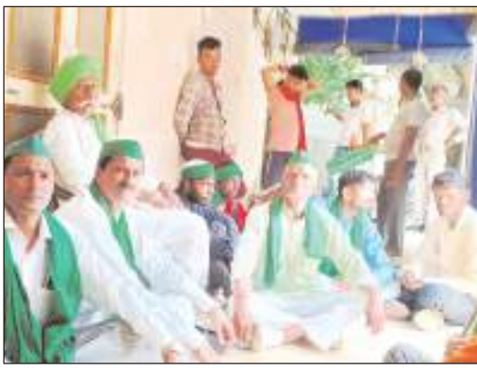
बिजली घर पर पहुंचे। बिजली घर पर अधिकारियों के न मिलने पर अधिशासी अभियंता विद्युत विभाग के ऑफिस में ताला लगाकर ऑफिस के

मथुरा/टीएम एक्शन इंडिया इन दिनों जनपद में विद्युत विभाग कई तरह के आरोपों के घेरे में है। लोग अपने तरीके से अपना आक्रोश जता रहे हैं। भारतीय किसान यूनियन टिकैत के कार्यकर्ताओं ने गुरुवार को पागल बाबा बिजली घर प्रदर्शन किया। भारतीय किसान यूनियन टिकैत के कार्यकर्ता पागल बाबा