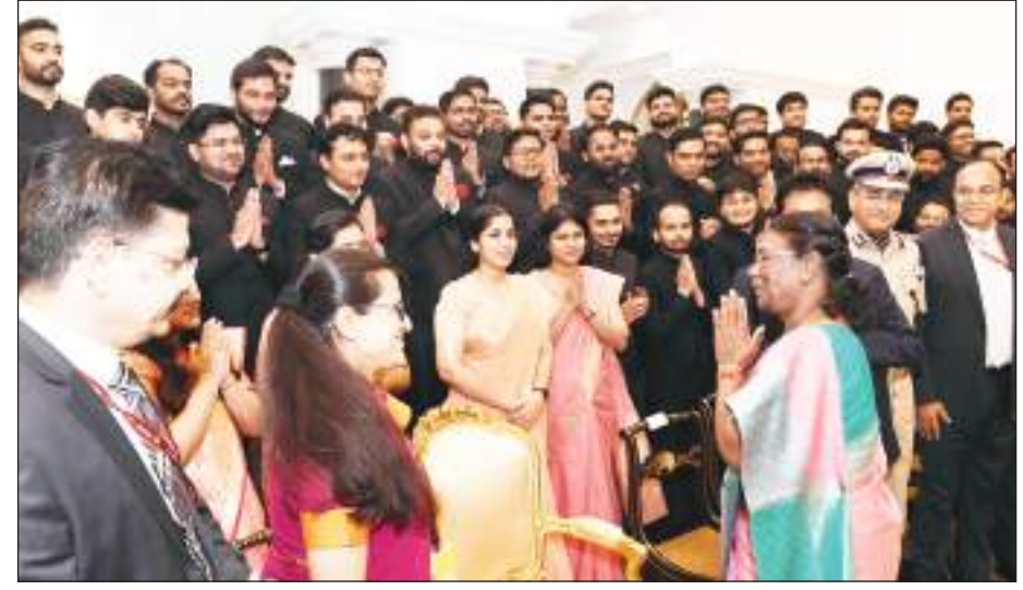
भारतीय रेलवे (2018 बैच) के 255 प्रोबेशनर्स के एक समूह ने गुरुवार को राष्ट्रपति भवन सांस्कृतिक केंद्र में राष्ट्रपति द्रौपदी मुर्मू से मुलाकात की।

आतंकवाद-रोधी बल के रूप में खड़ा किया गया था। इसके पास एक विशेष दस्ता भी है जो वर्तमान में उच्च जोखिम वाले वीवीआईपी को सशस्त्र सुरक्षा कवर प्रदान करता है।