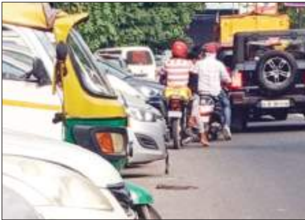
ही पार्किंग में तब्दील कर दिया है। वहीं वार्ड 61-62 स्थित सम्राट इंकलेव से सुभाष पैलेस थाना व शकुरपुर आनंदवास जाने वाले दोनों तरफ की सड़क को लोगों ने

कर रहे हैं त्रीनगर विधानसभा क्षेत्र की, जो कि कहने में तो पॉश एरिया की लिस्ट में शुमार है, लेकिन यहाँ पर लोगों ने पार्किंग न होने के चलते मुख्य सड़क को