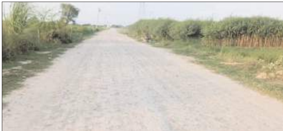
सिंह ने कहा कि पीडब्ल्यूडी विभाग द्वारा सड़क चौड़ाकरण कर पुनः बनाने के लिए उखाड़ी गई थी।

मथुरा/टीएम एक्शन इंडिया चौमूहा क्षेत्र में हाईवे से पसौली होती हुई शेरगढ़ तक गई सड़क पिछले छह माहों से उखड़ी पड़ी है। उखड़ी सड़क से ग्रामीणों को निकलने में परेशानी का सामना करना पड़ रहा है। पीडब्ल्यूडी विभाग द्वारा कस्बा के सड़क थोड़ी सी सड़क मरम्मत कराकर अब पल्ला झाड़ दिया है। ग्रामीण गंगा