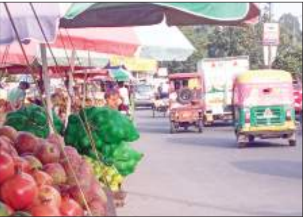
टीएम एक्शन इंडिया/नई दिल्ली राजधानी दिल्ली में सड़कों पर अतिक्रमण किसी संक्रमण या वायरल फ्लू के भाँति बड़ी ही तेजी के साथ पांव पसार रहा है।

चाहें वह दिल्ली की मुख्य सड़क हो या फिर कॉलोनी की छोटी-छोटी गलियाँ ही क्यों न हों, सभी जगह का बुरा हाल है, कहीं पर रेहड़ी-पटरी लगाकर सड़क कब्जा